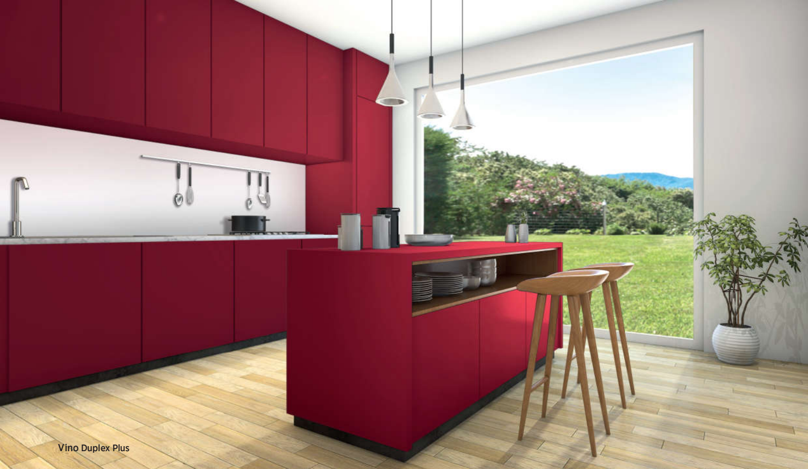
Vino Duplex Plus