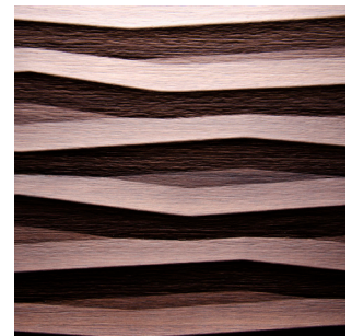
Kernnussbaum Echtholz furnier