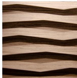
Nussbaum Alpi Furnier