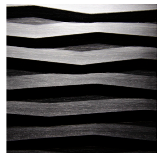
Schwarz Alpi Furnier