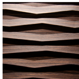
Eiche Schoko Alpi Furnier