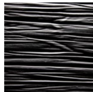
Schwarz Alpi Furnier