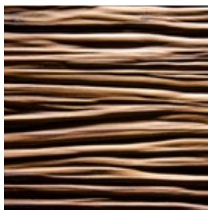
Lärche geräuchert Echtholz furnier