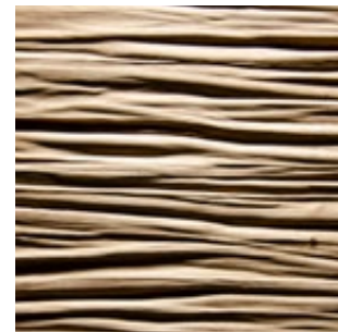
Asteiche Echtholz furnier