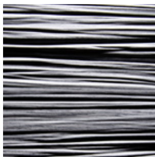
Grau Alpi Furnier