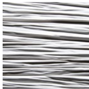
Weiß Alpi Furnier

Geradheit: 3,0 mm pro Meter Maßhaltigkeit: +/- 1,0 mm pro Meter Dickentoleranz: +/- 0,5 mm Profilgenauigkeit: +/- 1,5 mm