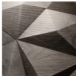
Eiche grau Echtholz furnier