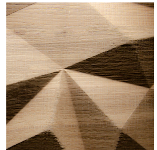
Eiche Natur Echtholz furnier