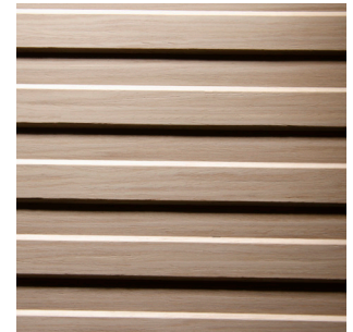
Eiche hell Alpi Furnier