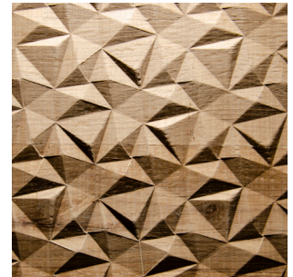
Eiche natur Echtholz furnier