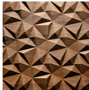
Eiche geräuchert Echtholz furnier