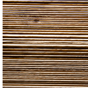
Asteiche rustikal Echtholz furnier

Geradheit: 3,0 mm pro Meter Maßhaltigkeit: +/- 1,0 mm pro Meter Dickentoleranz: +/- 0,5 mm Profilgenauigkeit: +/- 1,5 mm