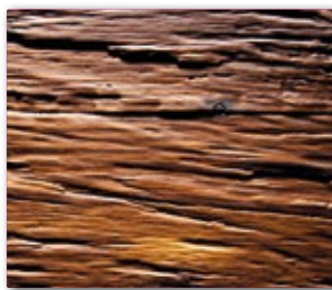
2590 Reliefplatte Chopped Wood Lärche geräuchert Oberfläche: Roh unlackiert