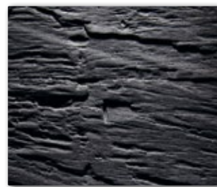
2590 Reliefplatte Chopped Wood Alpi schwarz Oberfläche: Ascheoptik lackiert

Eine grosse Auswahl an weiteren Dekoren finden Sie im VD Holz in Form Katalog unter www.formex.ch