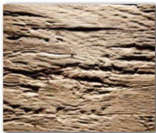
2590 Reliefplatte Chopped Wood Altholz Eiche Oberfläche: Roh unlackiert